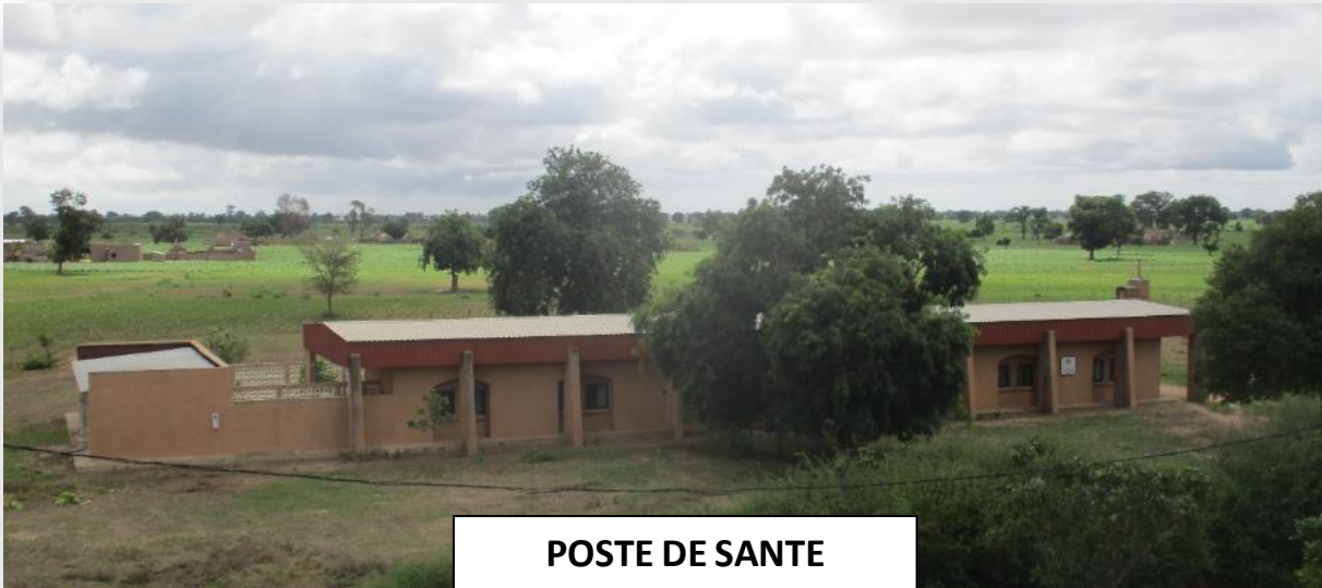
POSTE DE SANTE