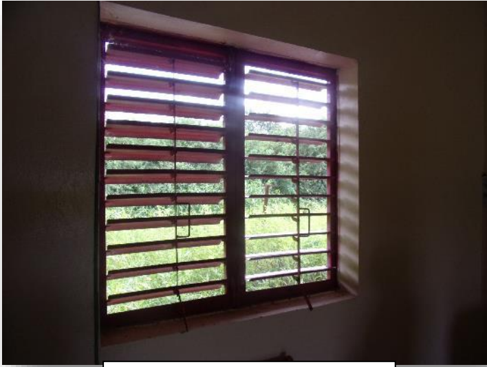
FENETRES A POSER