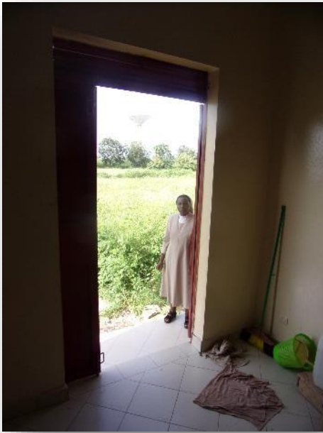
PORTE MOUSTIQUAIRE A POSER