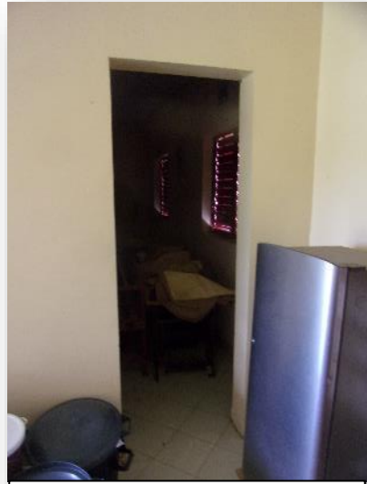
PORTE A POSER